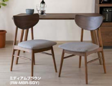
ミディアムブラウン (RW-MBR-SGY) ライトブラウン (RW-LBR-BR)

カラー ASH-BR / IC-LGY 材質 タモ無垢材(ラッカー塗装)・スチール・ファブリック・ウレタンフォーム 注釈 IC-LGY、IC-DGYの全2色