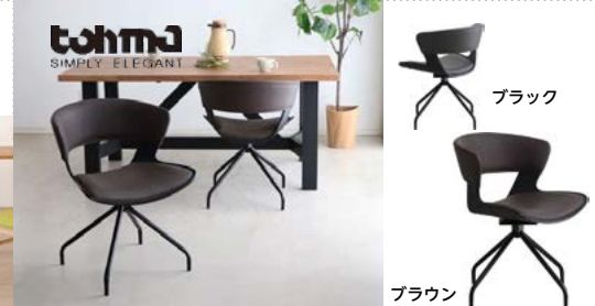
ブラック ブラウン